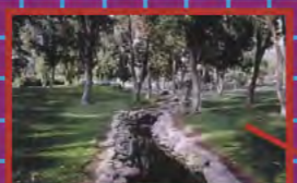
LE DÉJEUNER SUR L'HERBE