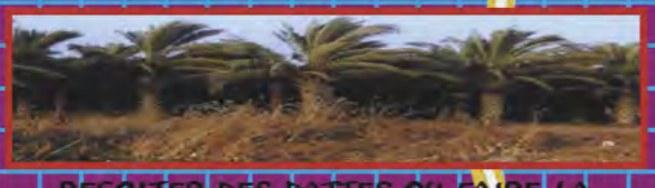
RECUPERER DES DATTES OU FAIRE LA CHASSE AUX OISEAUX, TERRIBLES PREDATEURS DE POISSONS, QUI VIVENT DANS DES PLANS D'EAUX AU SUD DU PARC. TOUT LES AQUA-LOISIRS IMAGINABLES SONT A ENVISAGER...