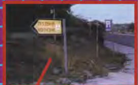
DIFFICILE DE SE PERDRE DANS LE PARC