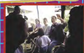
L'ENTHOUSIASME DES VISITEURS

LE CENTRE D'INFORMATION DU KIBBOUTZ EIN HAROD MAÎTRE D'ŒUVRE : LE MUSÉE D'ART MODERNE DE EIN HAROD MAÎTRISE D'ŒUVRE : LA TGAD (HORS LES MURS) & PARTNERS DEBUT DES TRAVAUX : 1996 (ETUDES) 1998 (PROTOTYPE) 2000 (CE PLAN) DESSIN ET TEXTE : NIEK VAN DE STEEG * : JEAN-PIERRE REHM (EXTRAIT DE L'ANNOTATION D'UN PLAN) COPYRIGHT : PAPAING & NIEK VAN DE STEEG, MARS 2000