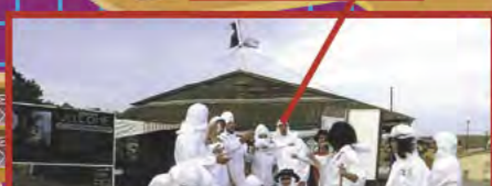
LES ANIMATEURS DU PARC