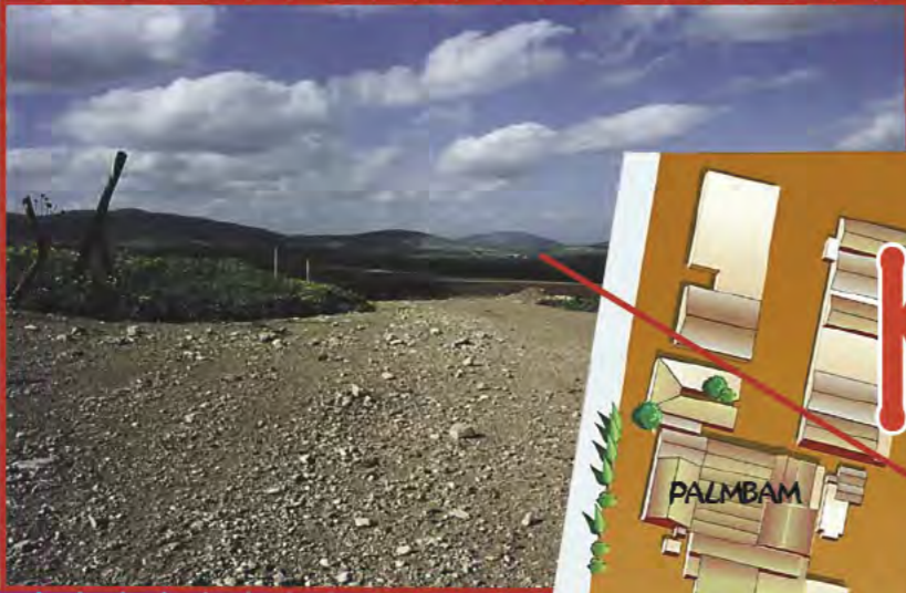
PROMENEURS PEUVENT ADMIRER LA VUE SOMBRIÈRE SUR LE MONT TABOR ET LA CAMPAGNE ENVIRONNANTE

HAUTE TECHNOLOGIE, AGRICULTURE ET SPORTS ÉQUESTRES SE VISITENT ET SE PRATIQUENT PAR LES CURIEUX ET AVENTURIERS