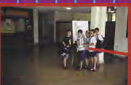
L'ORIENTATION EST AISEE A L'INTERIEUR DU PARC

VILLAGES DES NOUVEAUX PIONNIERS, HERBERGEMENT RUSTIQUE, MAIS CLIMATISÉ POUR LES VISITEURS DU PARC