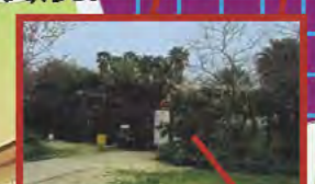
ENTRÉE DU JARDIN ZOOLOGIQUE ENTRETENU PAR LES ENFANTS DE EIN HAROD.