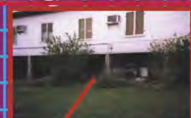
RANGEMENT ET ESPACE TECHNIQUE SOUS LES MAISONS