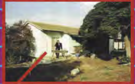
RESIDENCE DES ARTISTES