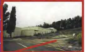
PARKING, PMUSEE, LIEU DITES DES 'GAMÉLEON-CARS', AVANT AGRANDISSEMENT DU MUSEE