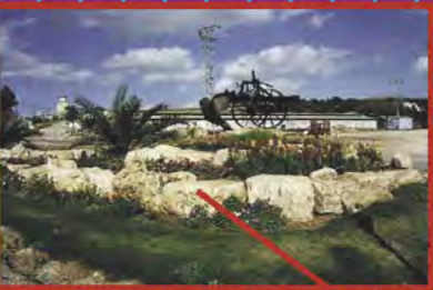
ENTRÉE POUR VISITER EIN HAROD IHUD

HAUTE TECHNOLOGIE, AGRICULTURE ET SPORTS ÉQUESTRES SE VISITENT ET SE PRATIQUENT PAR LES CURIEUX ET AVENTURIERS