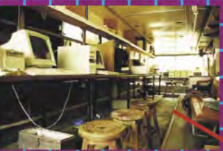
JEUX VIDEO ET DIVERTISSEMENT ÉLECTRONIQUE

VILLAGES DES NOUVEAUX PIONNIERS, HERBERGEMENT RUSTIQUE, MAIS CLIMATISÉ POUR LES VISITEURS DU PARC