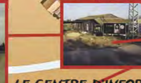
LE CENTRE D'INFORMATION