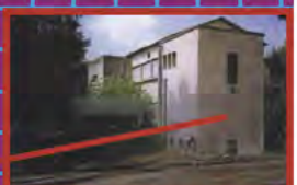
IMPRIMER DES TRACTS DANS L'ANCIENne IMPRIMERIE DU MOUVEMENT