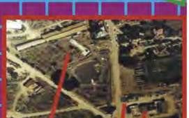
ABEDLAND, KIBBOUTZLAND POUR LES PETITS ET LES GRANDS.